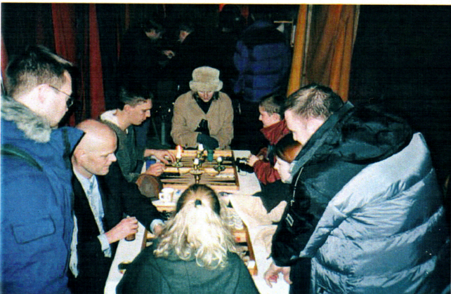
Även Rönn och Björn deltog.

På torsdagen var vi inbjudna till en stor maskeradbal med champagne, treätterers och underhållning. Efter kaffet kunde man även svänga sina lurviga till tonerna av en menuette.