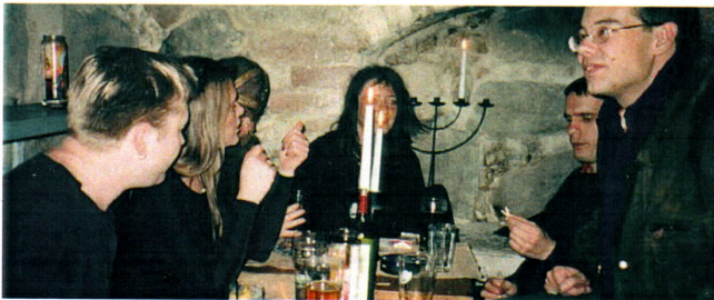
SBGF:s millenniegång i klassisk 1600-tals lönnkrogsmiljö.

festivalområdet och vi gjorde även gemensamma raidar på diverse medeltida lönnkrogar.