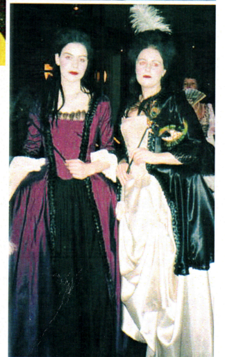
Galanta damer på bal.