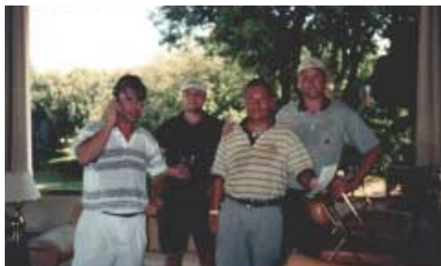
Monte Carlo Golf Club vid nittonde hålet. Fr v: Robban, artikelförfattaren, Lövet och Patrick.

ket på sig igen. När vi rundade hörnet till biografen var det mycket riktigt en hel del folk utanför som missade streaken!